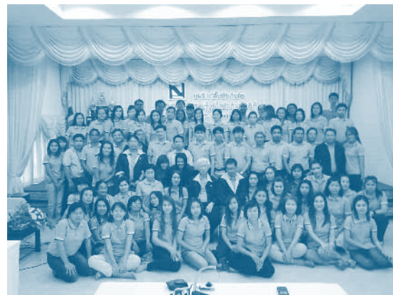
การฝึกอบรมพนักงานสาขา เรื่อง “รอบรู้ธุรกิจประกันภัย 8” วันที่ 17 – 18 พฤศจิกายน 2555 ณ อำเภอแม่เหล็ก จังหวัดสระบุรี