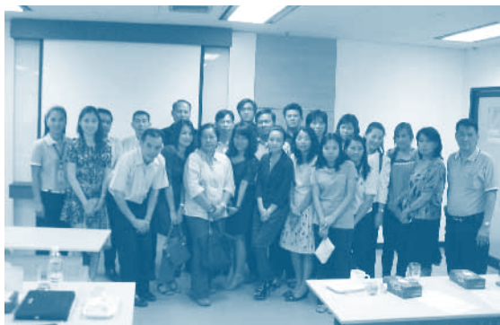
ฝ่ายกิจการตลาดจัดประชุม ตัวแทน/นายหน้าเกี่ยวกับผลิตภัณฑ์ พร้อมเยี่ยมชมหน่วยงานของบริษัทฯ ณ อาคาร นำสินประกันภัย สำนักงานใหญ่ เมื่อวันที่ 8 สิงหาคม 2555