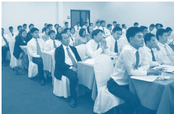
บริษัทฯ จัดอบรมหลักสูตรขอต่ออายุใบอนุญาตเป็นนายหน้าประกันวินาศภัย ครั้งที่ 1 ณ โรงแรมวังแก้ว จ.พิษณุโลก เมื่อวันที่ 19 พฤษภาคม 2555

บริษัทฯ คาดว่าเบี้ยประกันภัยรับตรงในปี 2556 จะขยายตัวไม่ต่ำกว่าอัตราการเจริญเติบโตของธุรกิจประกันวินาศภัย และคาดว่าจะมีส่วนแบ่งทางการตลาดของบริษัทฯ ในปี 2556 ไม่ต่ำกว่าปี 2555