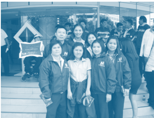
บริษัทฯ เข้าร่วมงานเปิดตัว “ปีแห่งการรณรงค์ส่งเสริมการสวมหมวกนิรภัย 100%” ณ สำนักงานคณะกรรมการและส่งเสริมการประกอบธุรกิจประกันภัย (คปภ.) เมื่อวันที่ 27 มีนาคม 2555

ในเรื่องการศึกษา ศาสนา และสาธารณประโยชน์ บริษัทฯ ได้มอบเงินเพื่อเป็นทุนการศึกษาให้แก่บุตรของข้าราชการฐานทัพเรือ และกรมการขนส่งทหารเรือ ในเดือนพฤษภาคม 2555 และเดือนมีนาคม 2555 ตามลำดับ ร่วมทำบุญทอดกฐินพระราชทาน วัดคงคารามวรวิหาร อำเภอเมือง จังหวัดเพชรบุรี เมื่อวันที่ 17 พฤศจิกายน 2555 ให้ความสนับสนุนงานกาชาดคอนเสิร์ตกองทัพเรือเฉลิมพระเกียรติฯ เมื่อวันที่ 29 สิงหาคม 2555 สนับสนุนการแข่งขันกอล์ฟการกุศลเพื่อสาธารณประโยชน์ และสาธารณกุศลต่างๆ ของกรมข่าวทหารเรือ เมื่อวันที่ 10 กุมภาพันธ์ 2555 สนับสนุนการแข่งขันกอล์ฟการกุศลของกรมพัฒนาธุรกิจการค้า เมื่อวันที่ 26 กรกฎาคม 2555 ให้การสนับสนุนกิจกรรมของสถานีตำรวจนครบาลเตาปูน โดยการสนับสนุนตู้ดับเพลิง เมื่อวันที่ 9 พฤศจิกายน 2555 นอกจากนี้ ได้บริจาคเงินสมทบทุนก่อสร้างโรงพยาบาลในเขตบางขุนเทียน กรุงเทพฯ เมื่อวันที่ 31 มีนาคม 2555