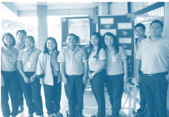
คณะกรรมการความปลอดภัยอาชีวอนามัยและสภาพแวดล้อมในการทำงาน (คปอ.) ของบริษัทฯ จัดงานสัปดาห์ความปลอดภัย ประจำปี 2555 ณ ด้านหน้าอาคารนำสินประกันภัย สำนักงานใหญ่ เมื่อวันที่ 24 – 25 ตุลาคม 2555