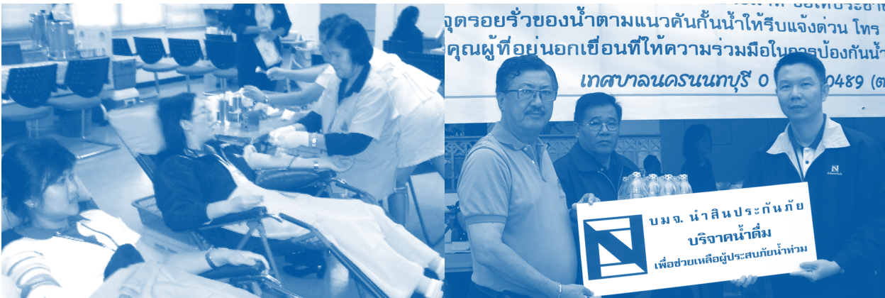
พนักงาน บมจ.นำสินประกันภัย ร่วมบริจาคโลหิตให้แก่ โรงพยาบาลศิริราช เมื่อวันที่ 6 ตุลาคม 2554

ในส่วนของเพื่อการพระศาสนา บริษัทฯ ได้ร่วมทอดกฐินสามัคคี วัดเขาวันชัยนวัตน์ จังหวัดนครราชสีมา และร่วม สมทบทุนสร้างอุโบสถ วัดแพร่ชาหยั่ง อำเภอท่าใหม่ จังหวัดจันทบุรี และวัดไชยมาศ อำเภอเชียงคาน จังหวัดเลย เมื่อวันที่ 6 พฤศจิกายน 2554 วันที่ 15 ตุลาคม 2554 และวันที่ 10 ตุลาคม 2554 ตามลำดับ